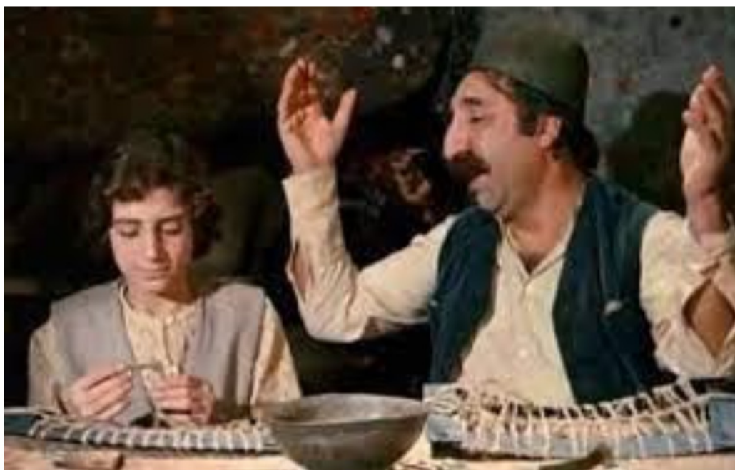
Grigor-gha die Torik leert hoe hij zadels moet maken voor ezels

Velen hebben de film in het hart gesloten en daarna nooit meer losgelaten, wijzelf meegerekend. "Mer Bake" is een geniale klasieker, het verveelt nooit en je zult elke keer weer iets nieuws bij het kijken van de film. Het leukste is om "Mer Bake" met meerdere mensen te kijken, want dit is het soort film die je wil delen met anderen. Tot op de dag van vandaag worden er citaten uit de film gebruikt in dagelijkse conversaties.