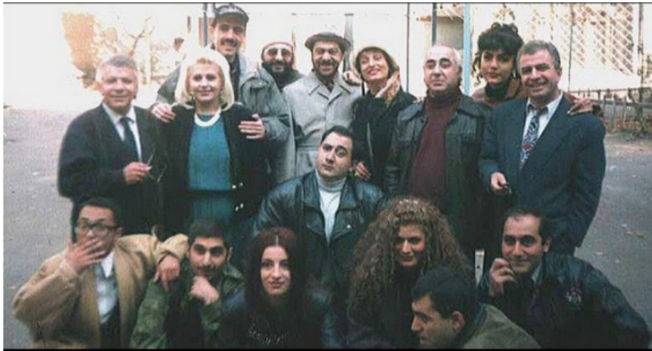
Foto: Still uit Mer Bake met de belangrijkste personages.