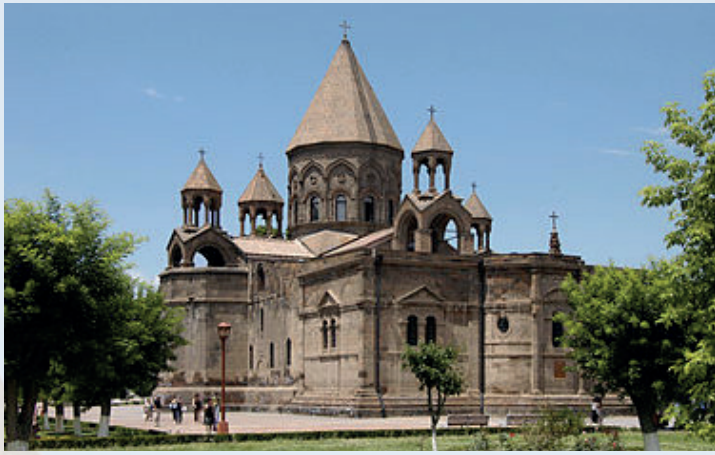
De Kathedraal van Etsjmiadzin (Armeens: Մայր Տաճար Սուրբ Էջմիածին; Mayr Tajar Surb Ejmiatsin; oorspronkelijk Heilige Moeder Gods Kerk geheten (Armeens: Սուրբ Աստուածածին Եկեղեցի; Surb Astvatsatsin Yekeghetsi)) is de oudste kathedraal van de wereld. De kathedraal is het middelpunt van de Armeens-Apostolische Kerk en is gelegen in de Armeense stad Etsjmiadzin.

Vroeger werd de Zegening van het Water gehouden aan een rivieroever of zee kust maar later, door verschillende omstandigheden, werd deze ceremonie in de kerken gehouden. Tijdens de ceremonie wordt het kruis in water gedoopt, wat gelijk staat aan de onderdompeling van Christus in de Jordaan. Vervolgens wordt er Heilig Chrisma, ook Myron genoemd, in het water gegoten vanuit een duifvormige houder. Dit ritueel staat symbool voor de verschijning van de Heilige Geest, in de gedaante van een duif, bij de doop waarop de stem van de Heer aan iedereen verkondigt dat Christus Zijn Zoon is.