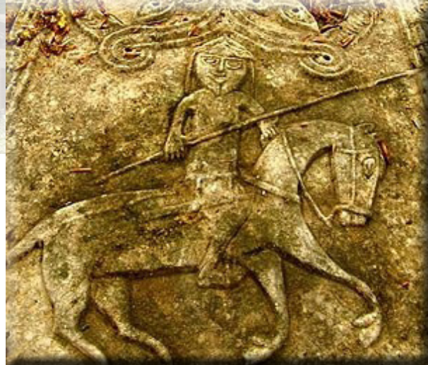
Afb. van de Cavalerie van het Khatsjen Vorstendom

De meeste Armeniërs zijn bekend met de recente geschiedenis van Artsakh. Echter heeft het gebied een oude en rijke geschiedenis welke niet altijd aan bod komt. De oudste herinneringen aan Artsakh gaan terug naar de tijd van Noach, wiens afstammelingen, volgens de verhalen, zich hebben gevestigd in dit gebied.