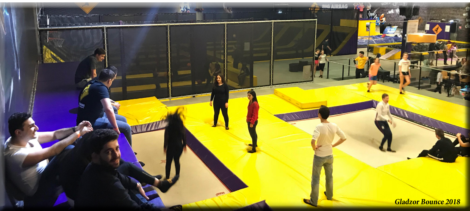
Gladzor Bounce 2018