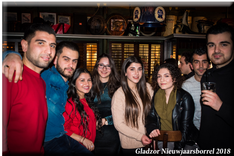
Gladzor Nieuwjaarsborrel 2018