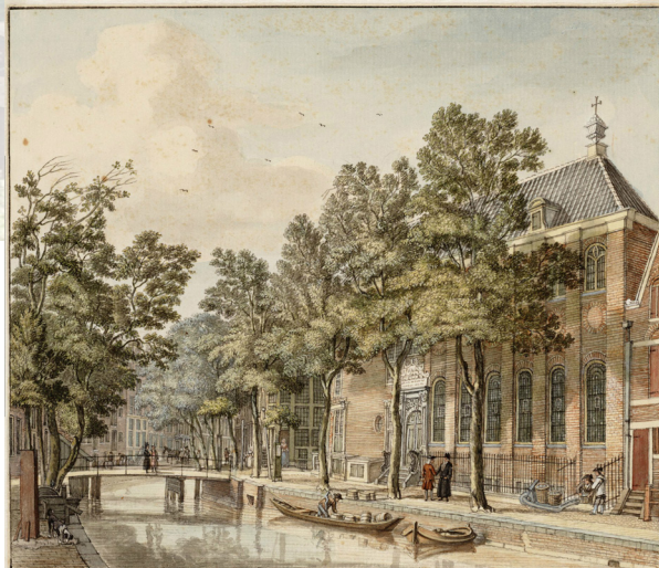
De Armeense Kerk 'Surp Hoki', te Amsterdam,

De eerste moderne significante immigratiegolf bestond dan ook uit Armeniërs uit Indonesië, welke terugkeerden naar Nederland in de jaren 50. Zij werden gevolgd door Armeniërs uit Turkije (de grootste groep), Libanon, en later Iran, Iraq en Rusland en Armenië.