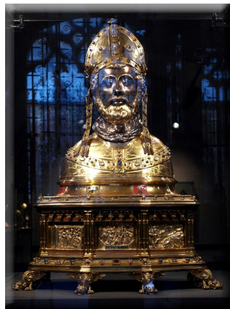
Het borstbeeld van Sint Servaas

De Armeense gemeenschap van Maastricht heeft in mei 2016 een "Chatsjkar" geschonken aan de stad Maastricht als dankbaarheid voor het behouden van het erfgoed van de heilige Servaas.