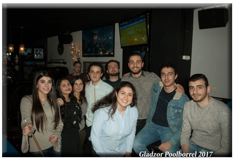
Gladzor Poolborrel 2017