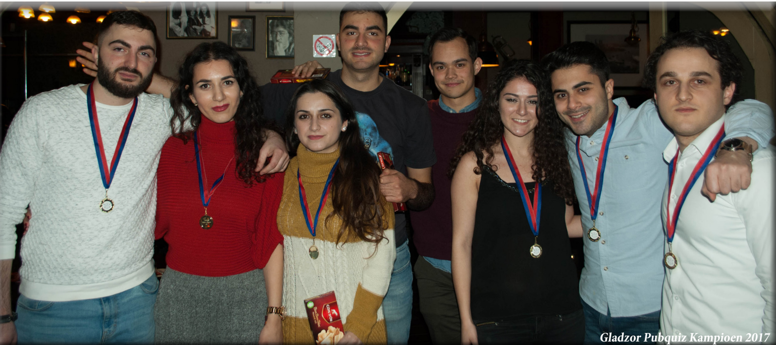
Gladzor Pubquiz Kampioen 2017