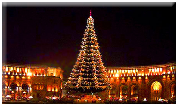
De Kerstboom van Yerevan, te zien vanaf begin dec.