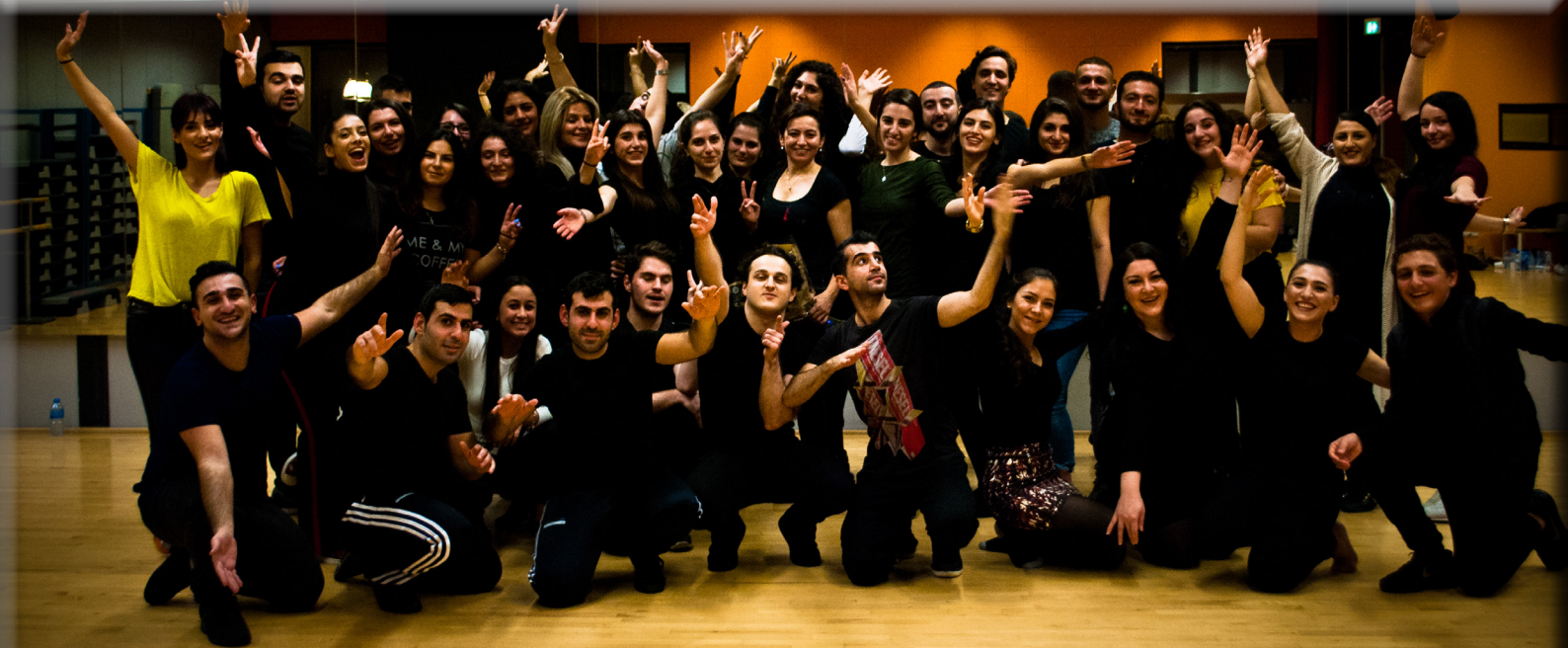
Gladzor Dansworkshop 2017