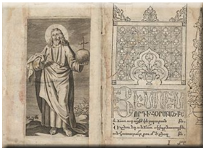
Matheos van Tsar - afgebeeld in boek

Matheos overleed op 3 januari 1661, net voordat zijn boek “Jezus zoon” (Hisus vordi) gepubliceerd werd. Hij werd begraven in de Oude Kerk van Amsterdam.