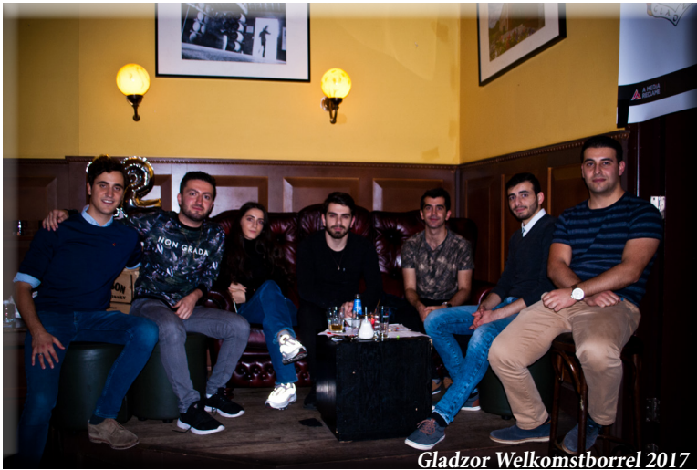
Gladzor Welkomstborrel 2017