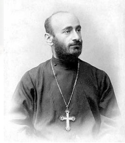
Komitas Vardapet begin 20 e eeuw